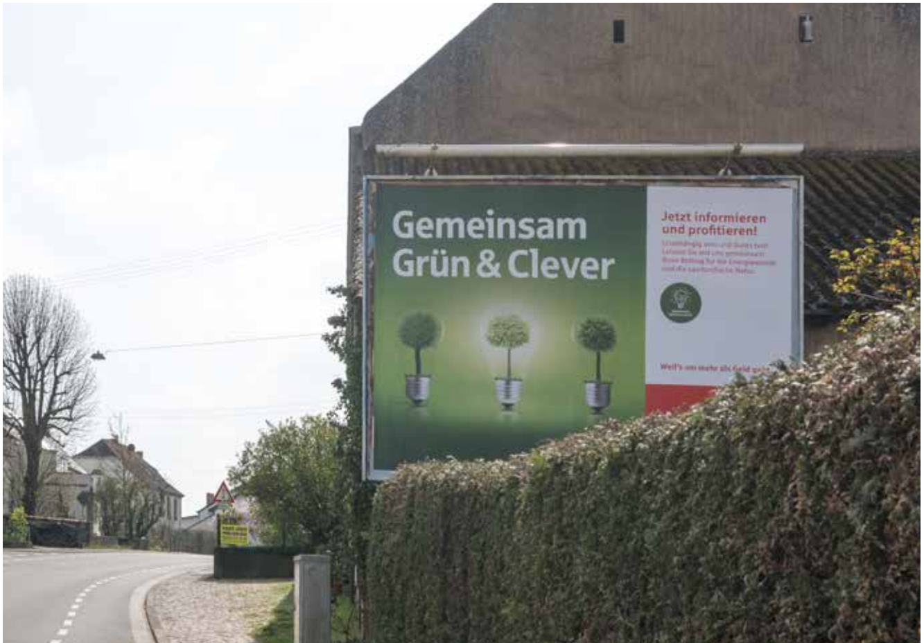
Werbeanlage im Bereich der Särkover Straße (Ortsdurchfahrt Ballern)

Hinsichtlich des Geltungsbereiches ergeben sich im Einzelnen folgende Änderungen / Ergänzungen: