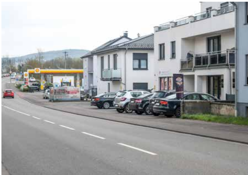
gewerblich geprägter Bereich in Hilbringen (Stadtteileingang aus Merzig kommend)

Die Werbeanlagen- und Warenautomatensatzung schafft damit einen planungsrechtlich fundierten Rahmen zur Steuerung von Werbeanlagen. Sie sichert die städtebauliche Qualität, schützt prägende Raumstrukturen und stellt eine ausgewogene Balan-