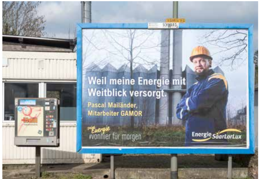
Warenautomat und Werbeanlage im Bereich der Merziger Straße (Ortskern Hilbringen)

unangepasste oder übermäßige Werbung zu vermeiden.