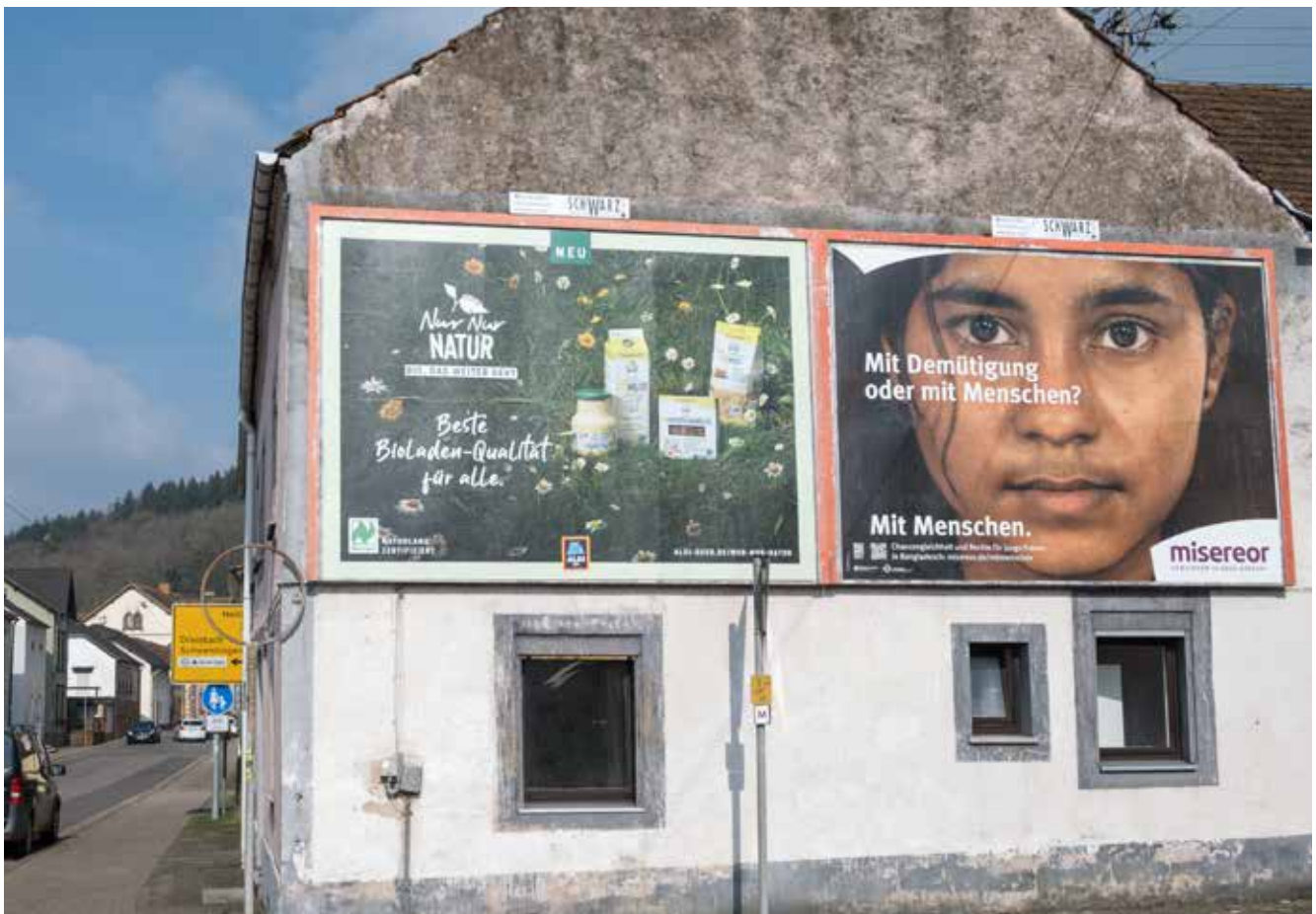
Großplakatwerbung im Bereich der Ortsdurchfahrt von Besseringen