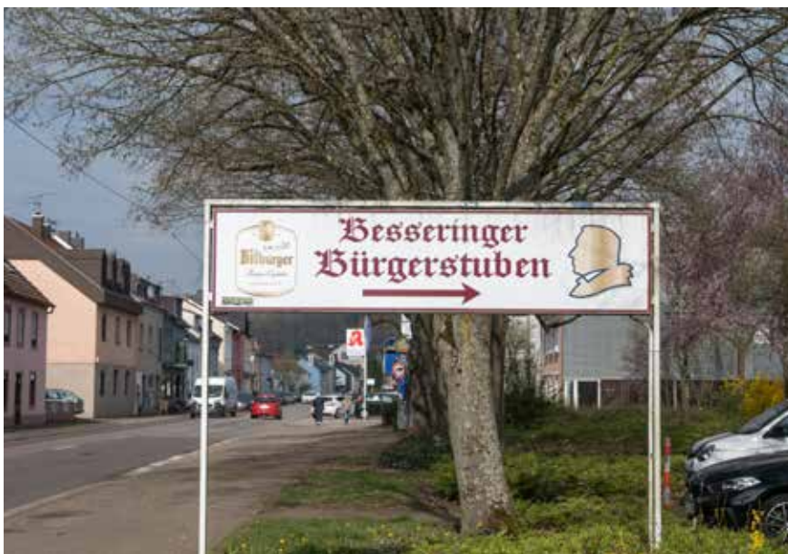
Werbeanlagen im Bereich der Ortsdurchfahrt von Besseringen