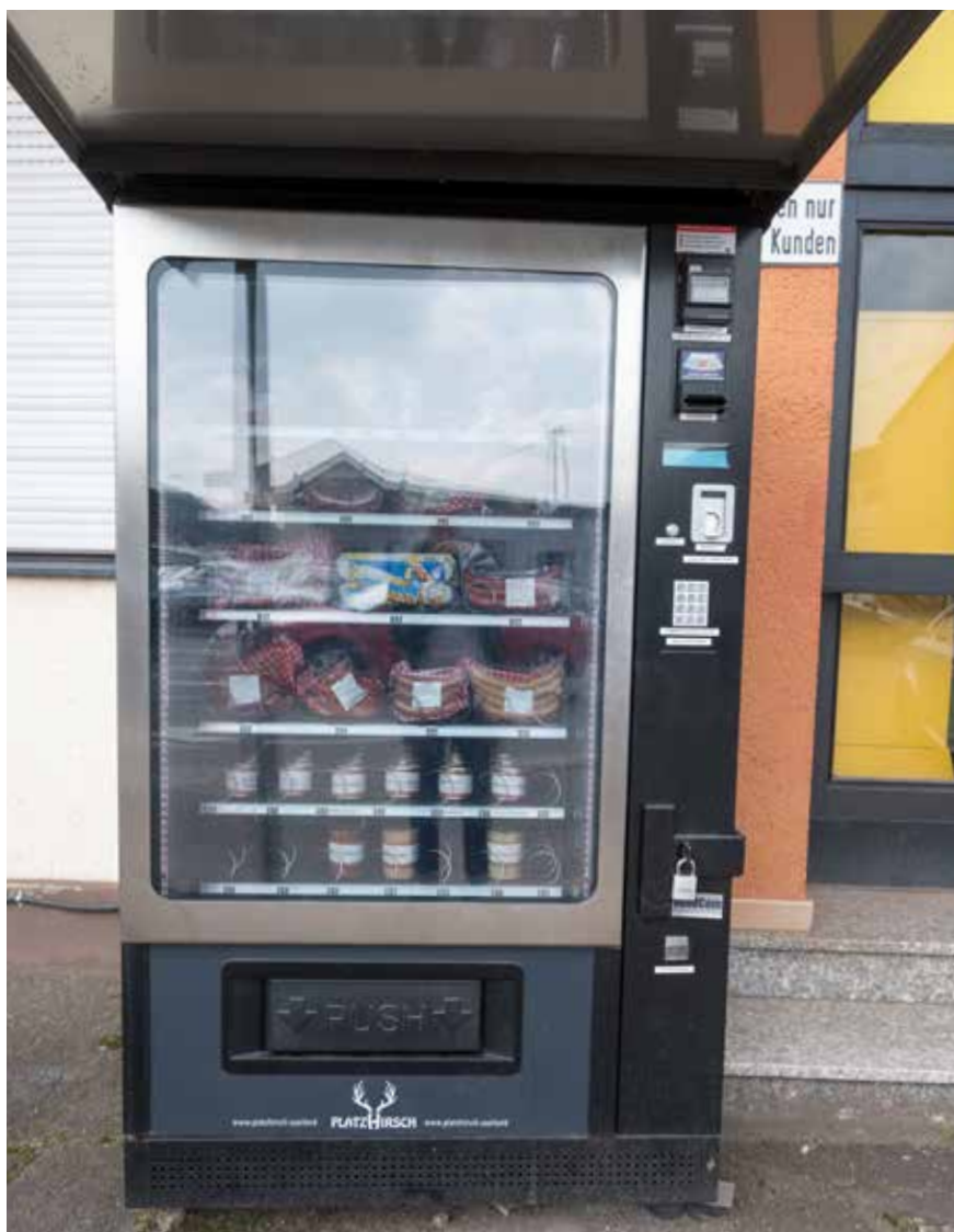
„Moderner“ Warenautomat im Bereich der Merziger Straße (Ortskern Hilbringen)

Diese Unterschiede spiegeln die Notwendigkeit wider, die Regulierungen flexibel an die jeweiligen städtebaulichen und sozialen Kontexte anzupassen, um sowohl den Erhalt des Stadtbilds zu gewährleisten als auch die lokale Wirtschaft zu unterstützen.