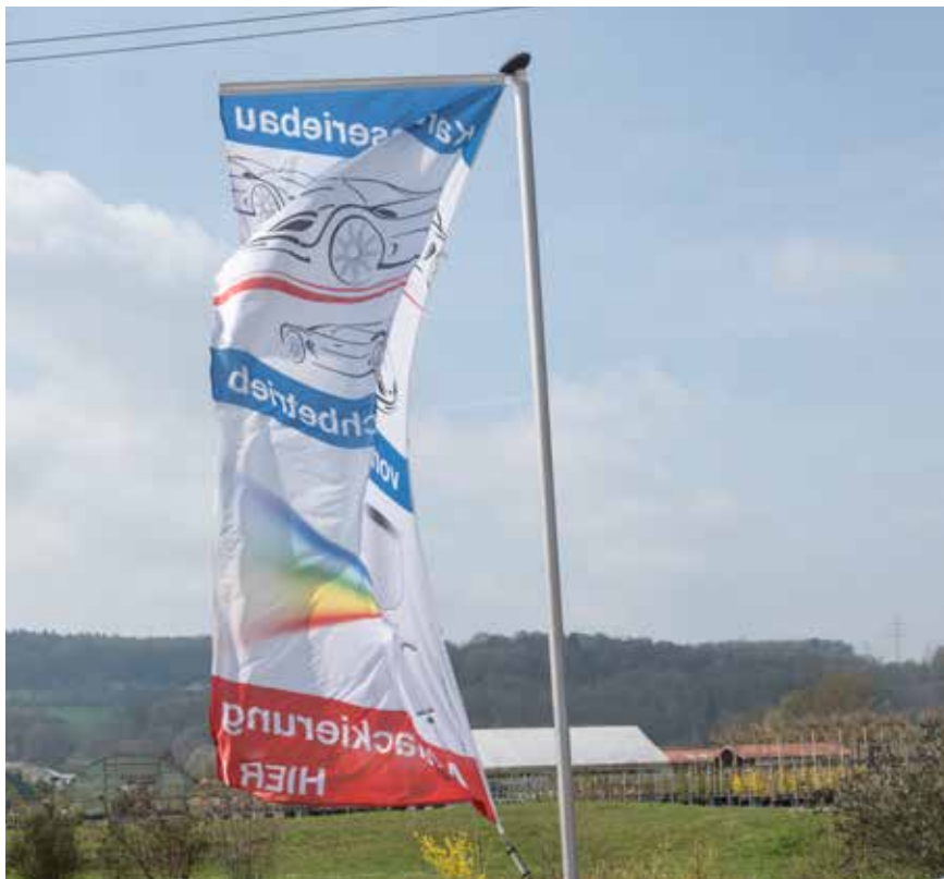
Bannerfahne im Stadtteil Ballern

Die Regelung der Zulässigkeit von Fahnen sowie die Festsetzung gestalterischer Vorgaben spielen eine wesentliche Rolle für das städtebauliche Erscheinungsbild einer Stadt. Durch die Einführung klarer Richtlinien wird eine harmonische Integration von Fahnen in das Stadtbild sichergestellt, was zur Erhaltung der ästhetischen Qualität und des kulturellen Charakters der Umgebung beiträgt. Solche Regelungen gewährleisten auch die Sicherheit im öffentlichen Raum, indem sie technische Anforderungen an die