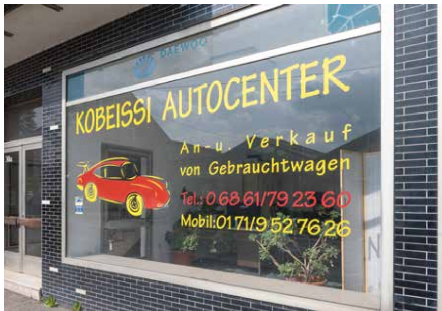
Schaufensterbeschriftung /-beklebung im Bereich der Merziger Straße (Ortskern Hilbringen)

Durch die Definition von maximal zulässigen Beschriftungs- / Beklebensflächen