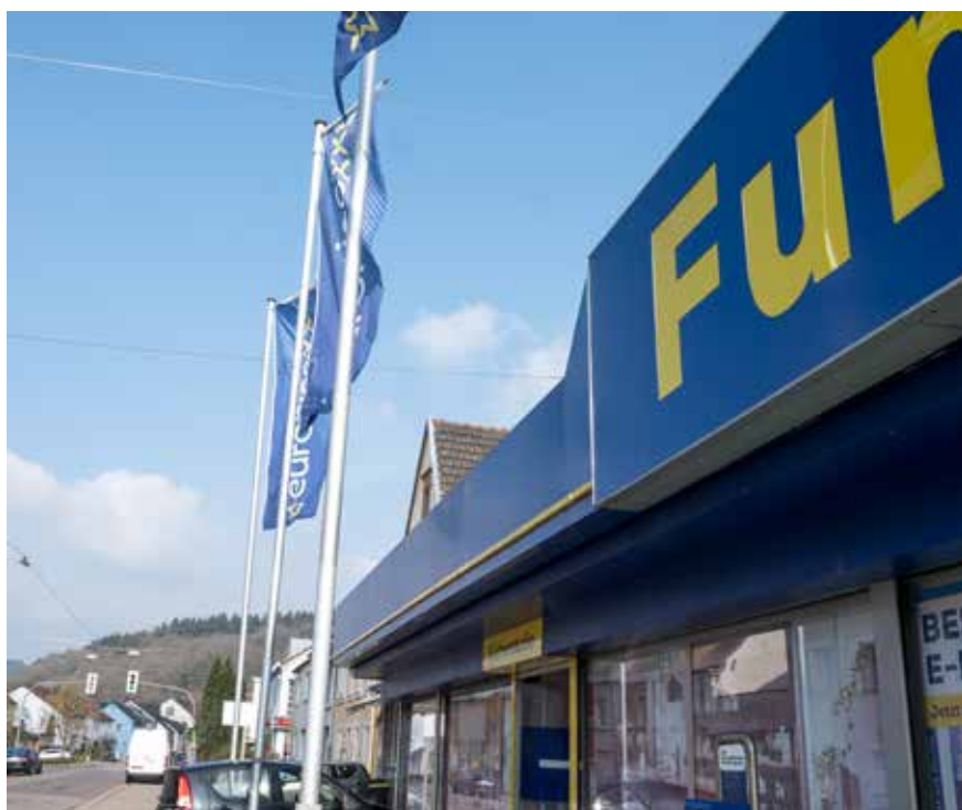
Hissfahnen im Bereich der Ortsdurchfahrt von Besseringen

Dropflags sind - wie bereits angeführt - typischerweise mobile Werbeelemente, die im Laufe eines Tages aufgestellt und wieder entfernt werden. Als nicht dauerhaft verankerte Werbeträger sind sie umkehrbar und beeinflussen das Stadtbild nicht dauerhaft. In moderater Anzahl eingesetzt, tragen sie zur Belebung des Straßenraumes bei. Im Gegensatz dazu erfordern permanent installierte Hiss- und Bannerfahnen einen gewissen Abstand zu Gebäuden und großzügige Aufstellflächen. Um das Stadtbild nicht zu beeinträchtigen, ist ihre Höhe