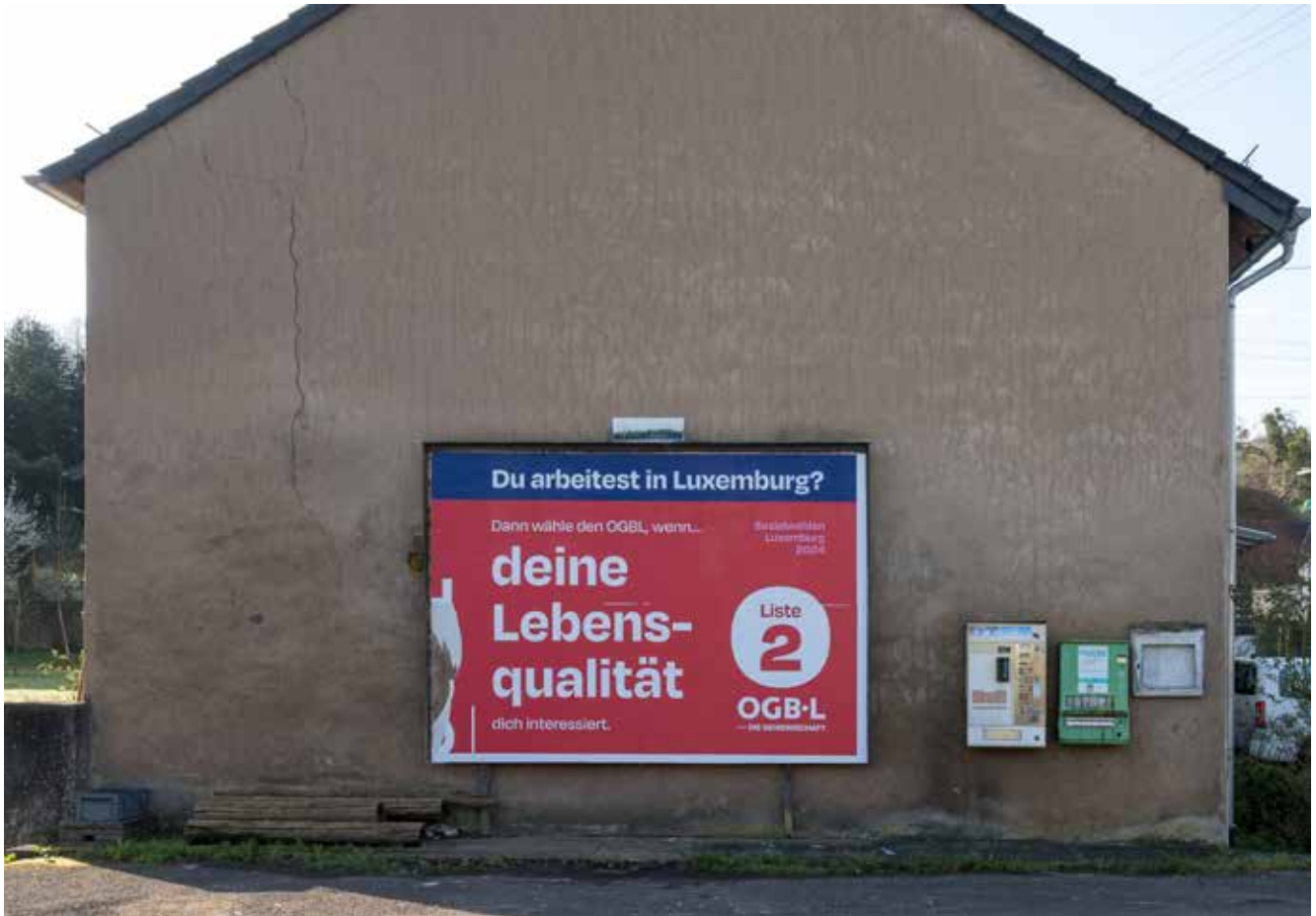
Fremdwerbeanlage im Bereich der Ortsdurchfahrt von Weiler (Perler Straße)