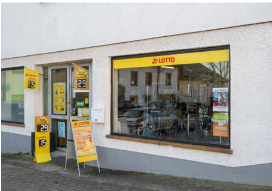
Werbeanlagen im Bereich der Ortsdurchfahrt Schwemlingen (Saareckstraße)

Bei den weiterhin nicht miteinbezogenen Flächen bzw. Stadtteilen handelt es sich in erster Linie um Wohngebiete, sodass die Ansiedlung von Werbeanlagen gemäß der Baunutzungsverordnung und Landesbauordnung (BauNVO, LBO) ausreichend geregelt ist (u. a. Werbung nur an der Stätte der Leistung). Dienstleistungs- und Gewerbebetriebe finden sich hier zudem nur in untergeordneter Anzahl, sodass bei Ansiedlung weiterer Werbeanlagen (z. B. Hinweisschild einer Bäckerei) durch diese keine störende Wirkung hervorgehen würde.