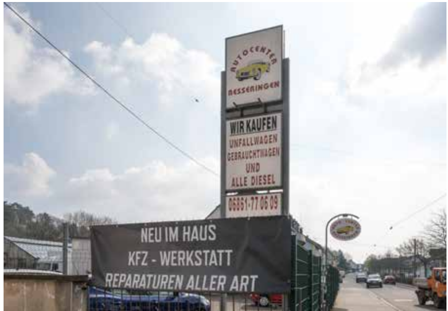
Werbeanlagen im Bereich der Ortsdurchfahrt von Besseringen

Die Ortskerne und (Teile der) Ortsdurchfahrten der Stadtteile, die bislang nicht oder nur teilweise in der Satzung waren, wurden aus diesem Grund nochmals hinsichtlich eines potenziell erforderlichen Regelungsbedarfs überprüft.