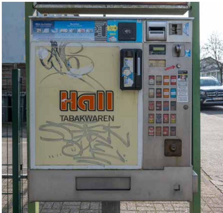
Warenautomat im Bereich der Ortsdurchfahrt von Besseringen (Bezirksstraße)

In der Werbeanlagen- und Warenautomatensatzung der Kreisstadt Merzig aus dem