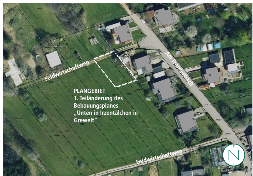
Luftbild mit Geltungsbereich; ohne Maßstab

Der Flächennutzungsplan der Kreisstadt Merzig stellt für das Plangebiet eine Wohnbaufläche dar. Das Entwicklungsgebot gem. § 8 Abs. 2 BauGB ist somit erfüllt.