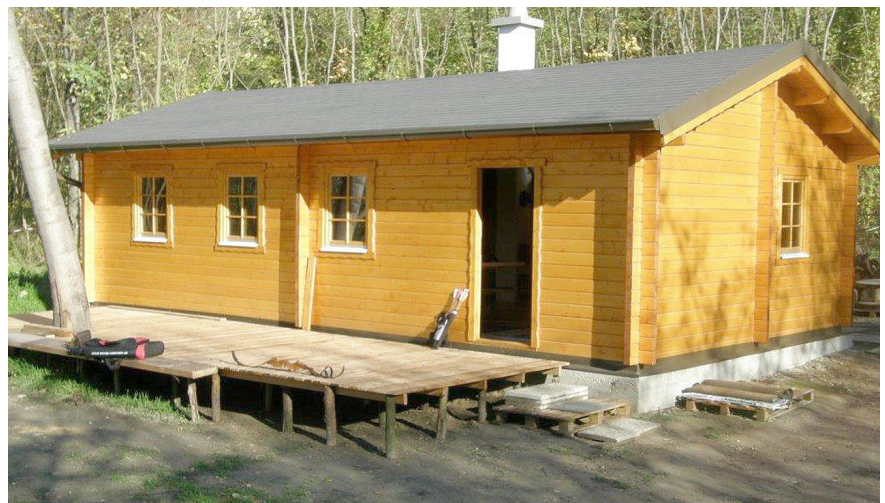
Hütte, Modell „Thule Blockhaus“, Quelle: www.thule-blockhaus.de

Eine Versiegelung des Grundstücks außerhalb der gebauten Fläche wird nicht erfolgen. Einen Teil der Niederschlagsmenge wird in einem geeigneten Behälter aufgefangen (Gießwasser), der restliche Anteil kann uneingeschränkt versickern.