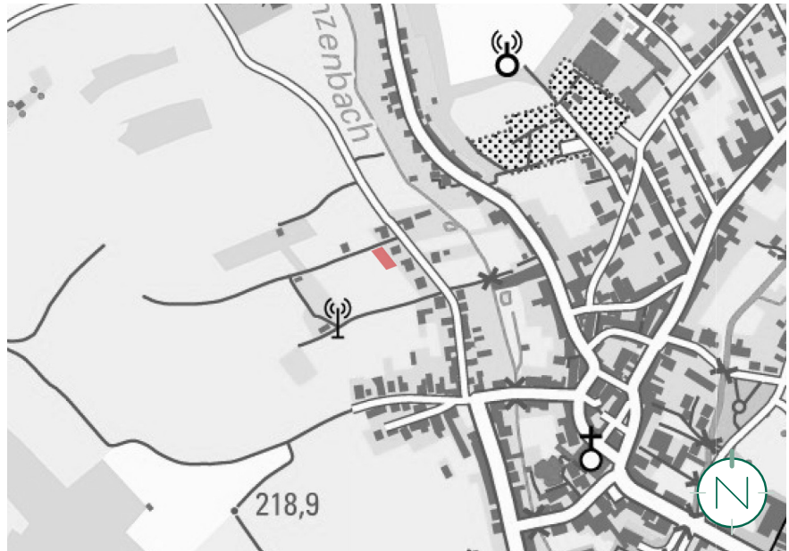
Lage im Raum, ohne Maßstab; Quelle: M 1:10.000; Quelle: ZORA, Z – 026/05, LVGL; Bearbeitung: Kernplan

Die Fläche des Geltungsbereiches ist (bis auf die Feldwirtschaftswege) in Privateigentum und wird an die Vorhabenträgerin der Kindertagespflege langfristig verpachtet. Aufgrund der Eigentumsverhältnisse ist von einer zügigen Realisierung der Planung auszugehen.