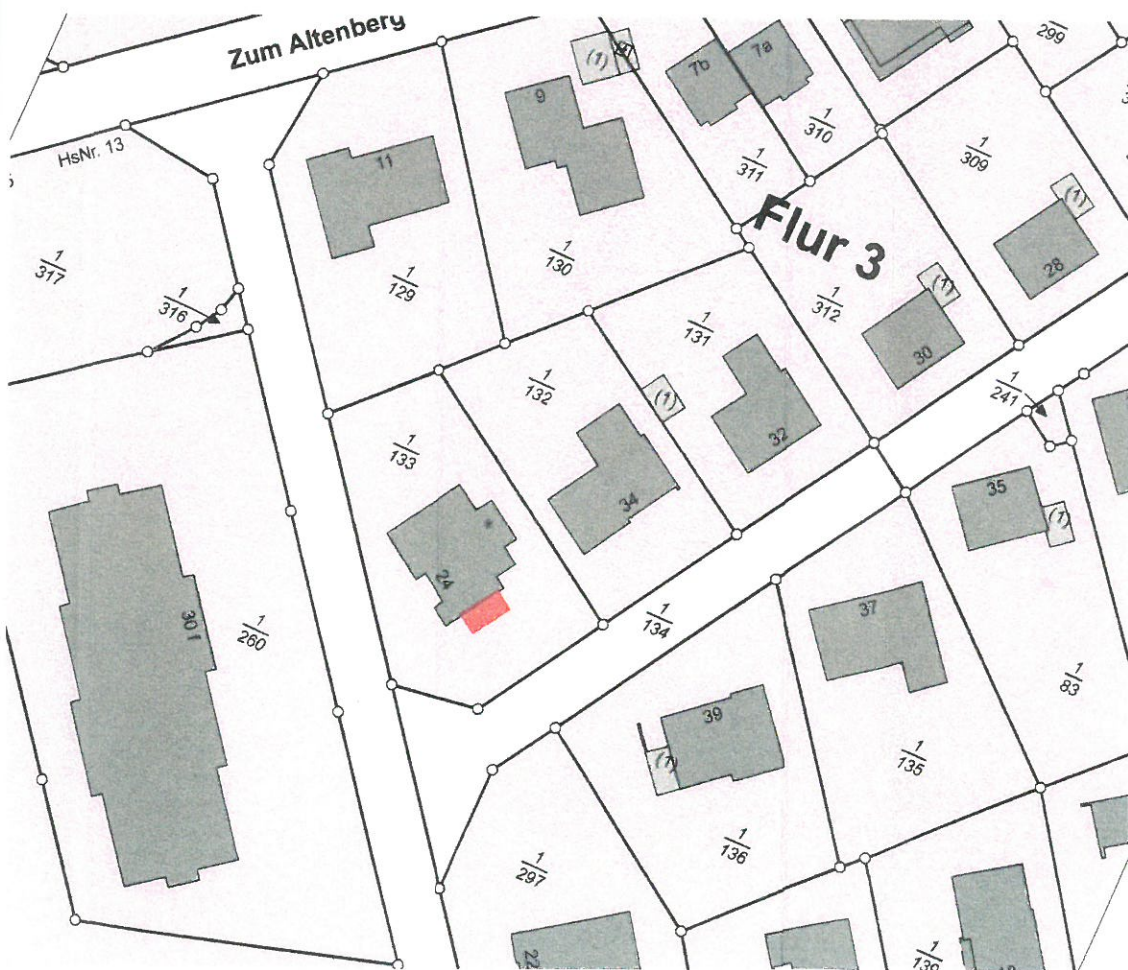
Ausschnitt Katasterplan M 1:1000