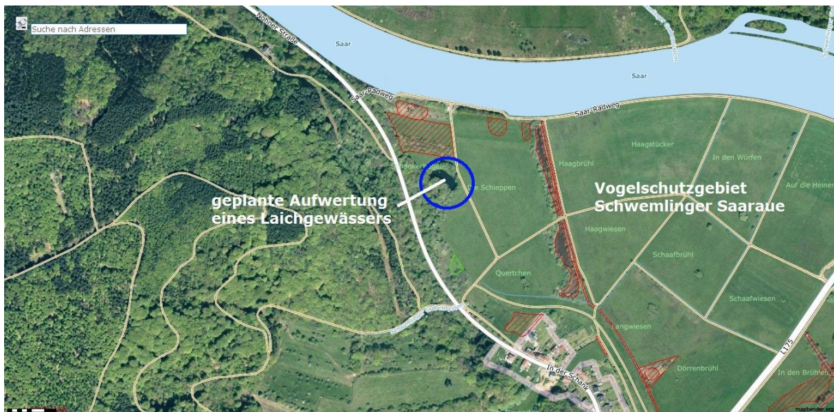
Abb. 1: Übersichtslageplan (Quelle Geoportal Saarland, unmaßstäblich, verändert)

Es handelt sich um einen Teich am westlichen Rand des Schutzgebietes in der Nähe der Verbindungsstraße von Schwemlingen nach Dreisbach (siehe Abb. 1). Das Gewässer findet sich im blauen Kreis, die rot schraffierten Flächen sind geschützte Biotope, die grün schraffierten Flächen sind als FFH-LRT auskartiert. Diese Schutzkategorien sind von der geplanten Maßnahme nicht betroffen.